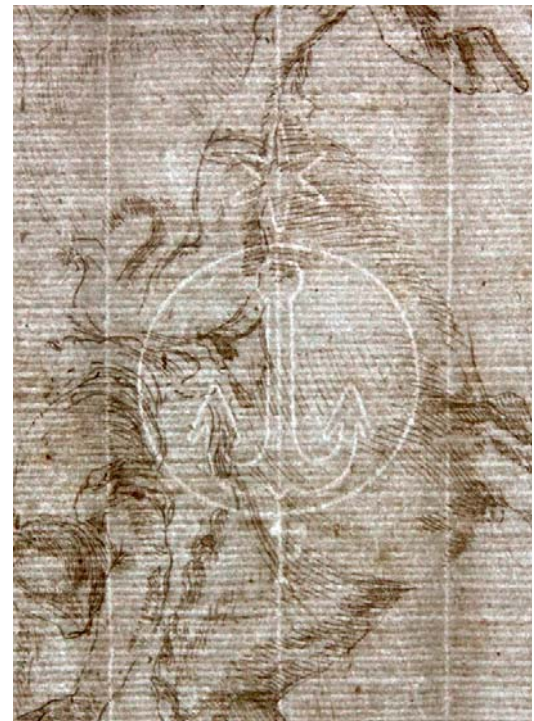
> Abb. 17 Studie des sogenannten Borghese Curtius. Durchlicht. Wasser- zeichen bestehend aus einem Anker in einem Kreis mit Stern und der Initiale F. Die (wolkigen) Stegschatten, die durch eine herstellungsbe- dingte Verdichtung des Faserstoffes an dieser Stelle zustande kom- men, sind insbesondere um die rechte Kettlinie herum gut sichtbar

Die an vielen Werken aus dem Ham- burger Klebeband und in Florenz fest- gestellten bräunlichen Verfärbungen in den Randbereichen fehlen im Pariser Klebeband vollständig. Es wird vermu- tet, dass sie durch frühere Verklebungen verursacht wurden, also von einer frü- heren Aufbewahrung stammen. Dies ist ein möglicher Hinweis darauf, dass die