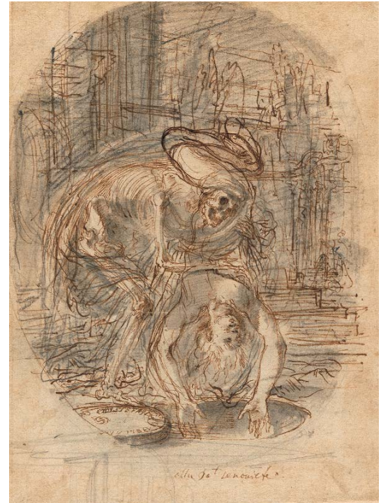
> Abb. 15 Der Tod wirft eine Frau kopfüber in ein Grab. Dunkelgraue Lavierung. Inv.-Nr. 1967-133