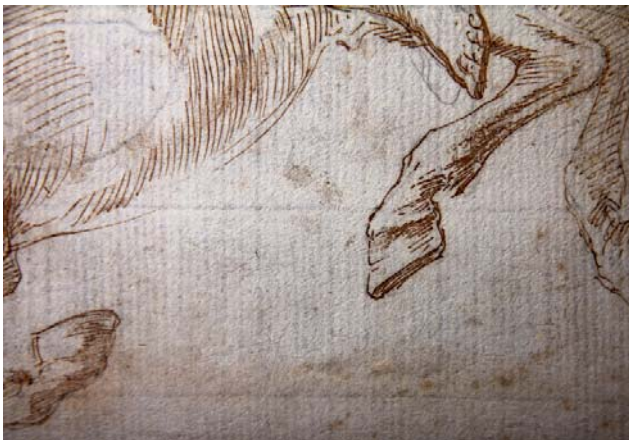
< Abb. 16 Studie des sogenannten Borghese Curtius. Streif- licht von rechts. Die horizontal zur Zeich- nung verlaufenden Kettdrahtlinien und die feineren Rippdraht- linien sind als Abdruck in der Papieroberfläche gut zu erkennen