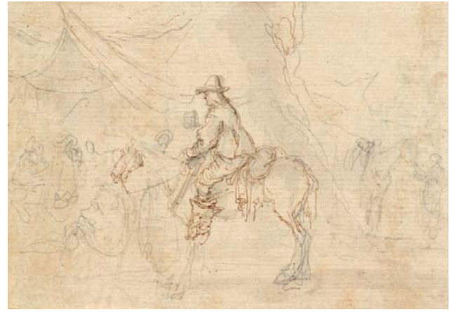
> Abb. 3 Reiter im Profil nach links vor einem Zeltlager. Die Vorzeichnung wurde nur stellenweise mit Tinte überarbeitet. Inv.-Nr. 1967-238