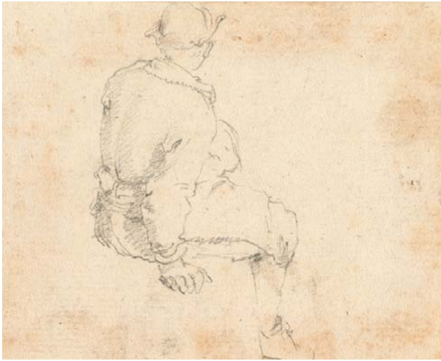
< Abb. 8 Studie eines sitzenden, sich mit der rechten Hand abstützenden Mannes von hinten. Schwarzer Stift. Inv.-Nr. 1967-218