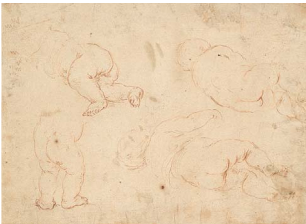
< Abb. 10 Vier Studien eines Klein- kundes. Mit Rötzel aus- geführte Vorzeichnung. Inv.-Nr. 1967-156