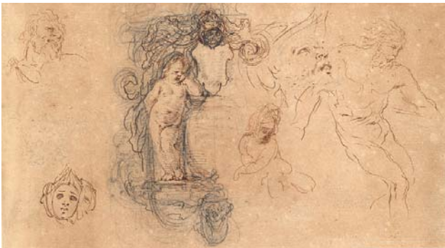
< Abb. 4 Kartusche mit stehendem und sitzendem Putto. Mit Graphit überarbeitete Federzeichnung. Inv.-Nr. 1967-81