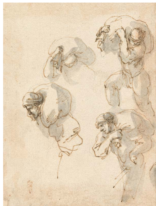
> Abb. 13 Vier Studien von Sackträgern. Feder in Braun, zartgrau laviert. Inv.-Nr. 1967-165