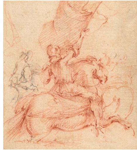
> Abb. 9 Galoppierender Reiter mit Fahne in Rücken- ansicht. Rötzelzeichnung mit schwarzem Stift. Inv.-Nr. 1967-122