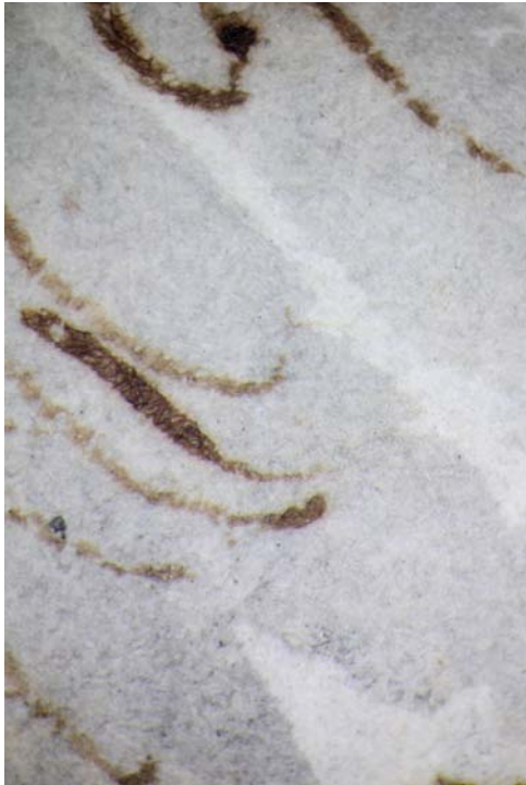
< Abb. 14 Putto mit erhobenen Armen zwischen auf- steigenden Leopard- köpfen. Detail. Graue Lavierung. Inv.-Nr. 1967-70