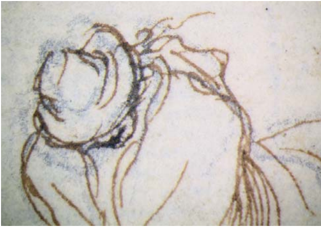
< Abb. 2 Mehrere Figuren in stürmischem Wind. Detail. Vorzeichnung und Tintenlinie. Inv.-Nr. 1967-164