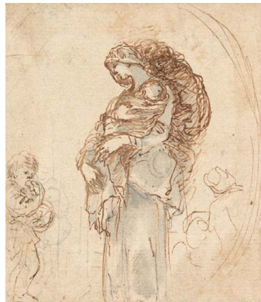
> Abb. 11 Stehende junge Frau in Seitenansicht mit einem Kind auf dem Rücken. Vermutlich farbliche Veränderung der Tinte 29 . Inv.-Nr. 1967-261