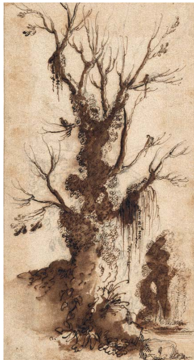
< Abb. 12 Studie eines Baumes, Feder in Braun, braun laviert, Spuren von Graphit. Inv.-Nr. 1967-349