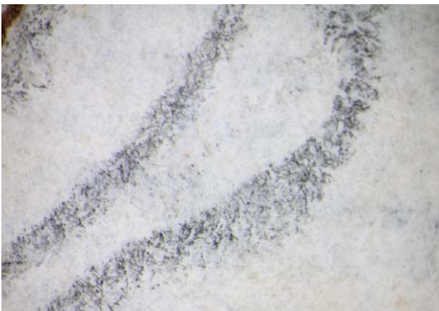
< Abb. 6 Entwurf für ein Medaillonbildnis von Cosimo de' Medici und Marguerite Luise d'Orléans. Detail. Schwarzer Stift. Inv.-Nr. 1967-79