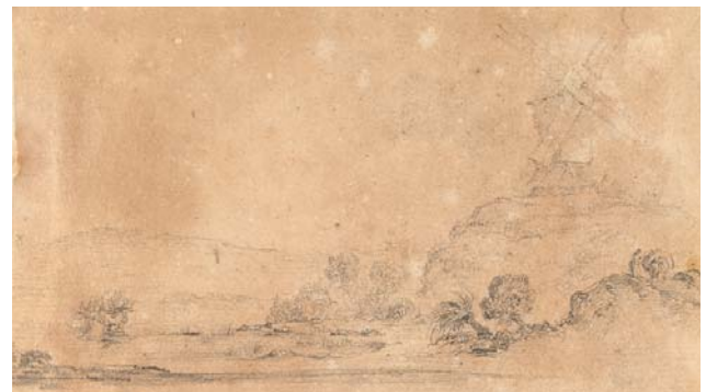
> Abb. 7 Landschaft mit Bockwindmühle. Graphitstift auf beigefarbenem Papier 29 . Inv.-Nr. 1967-123

Die lateinische Bezeichnung Plumbago hat in der Vergangenheit dazu geführt, dass Graphit irrtümlicherweise für Blei (lat. Plumbum) gehalten wurde, was zu den Bezeichnungen Bleigriffel oder Bleistift geführt hat. 31